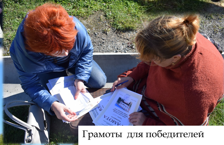
Грамоты для победителей