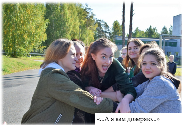
«...А я вам доверяю...»