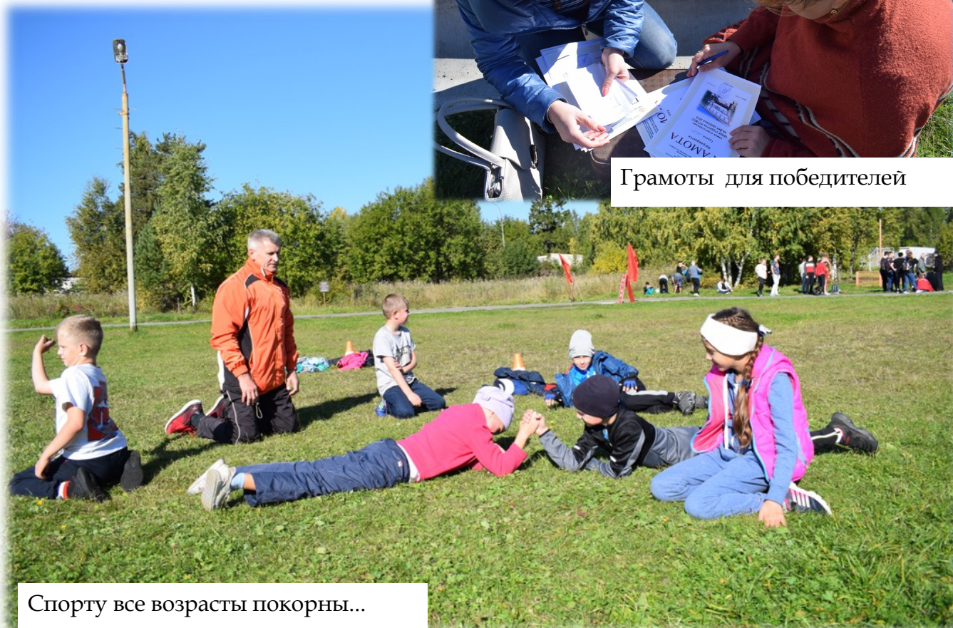
Спорту все возрасты покорны...