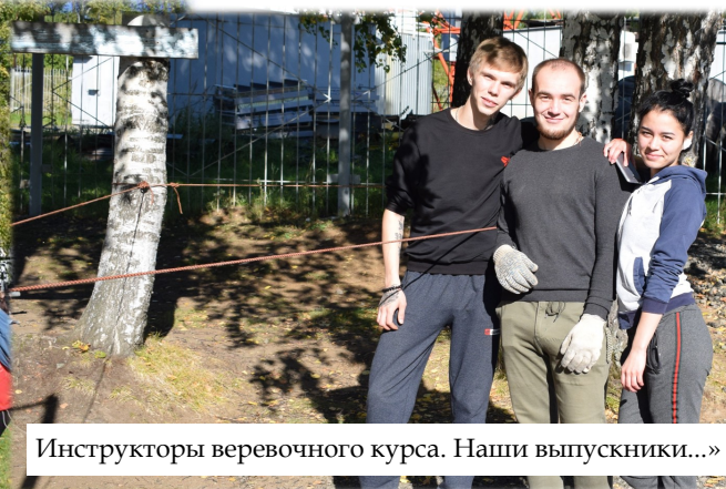
Инструкторы веревочного курса. Наши выпускники...»