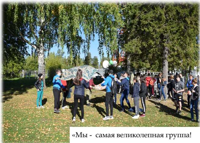
«Мы - самая великолепная группа!»

Самая великолепная группа оказалась 105/1. Ребята помогали друг другу в преодолении препятствий. Старосты групп выполняли задания на смекалку и догадливость (как с высоты сбросить яйцо, чтобы оно осталось целым) Каждую группу отличало какое-либо качество в коллективе: самая дружная, самая смелая, и т.д.