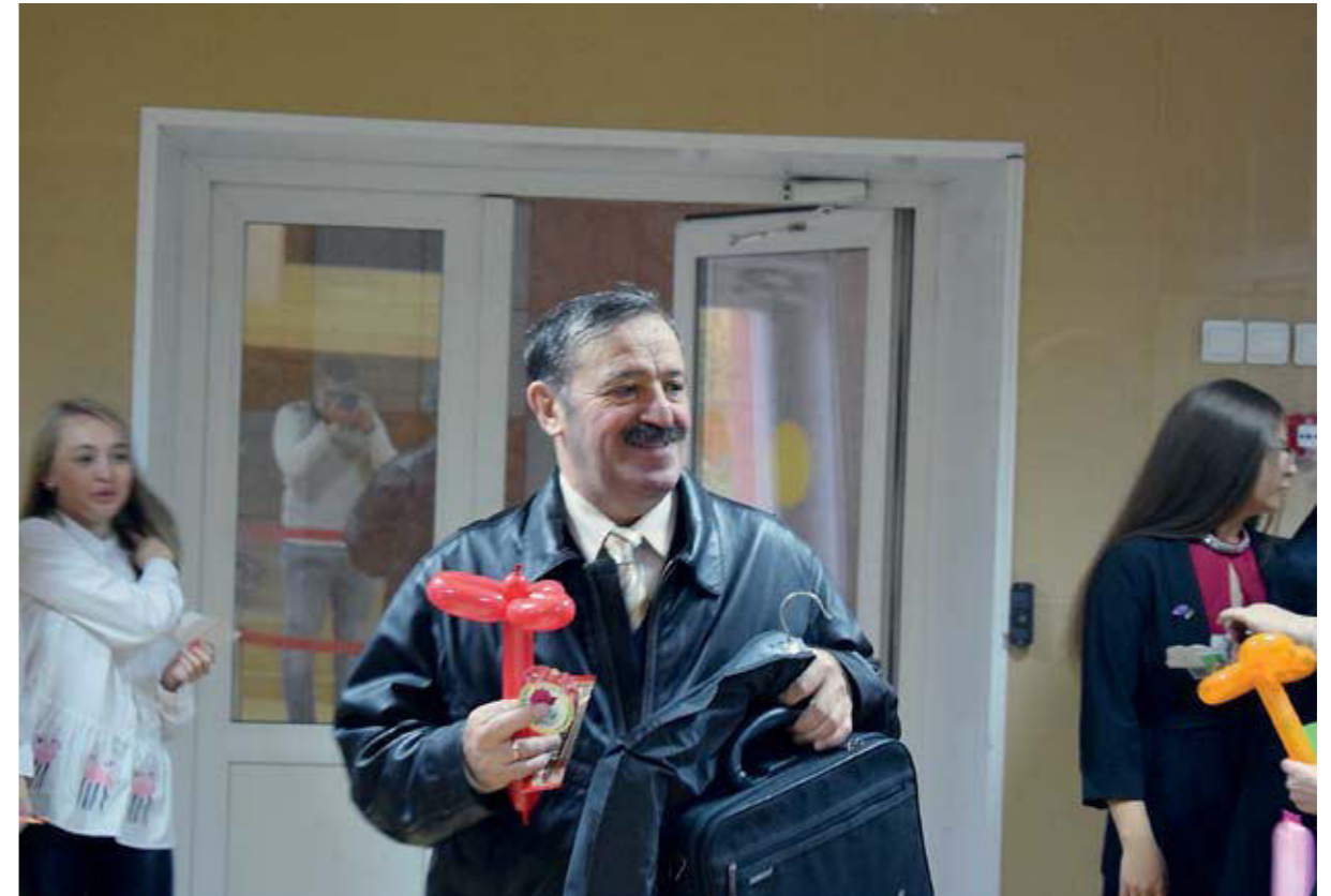
День учителя в техникуме. 05.10.2018 г.