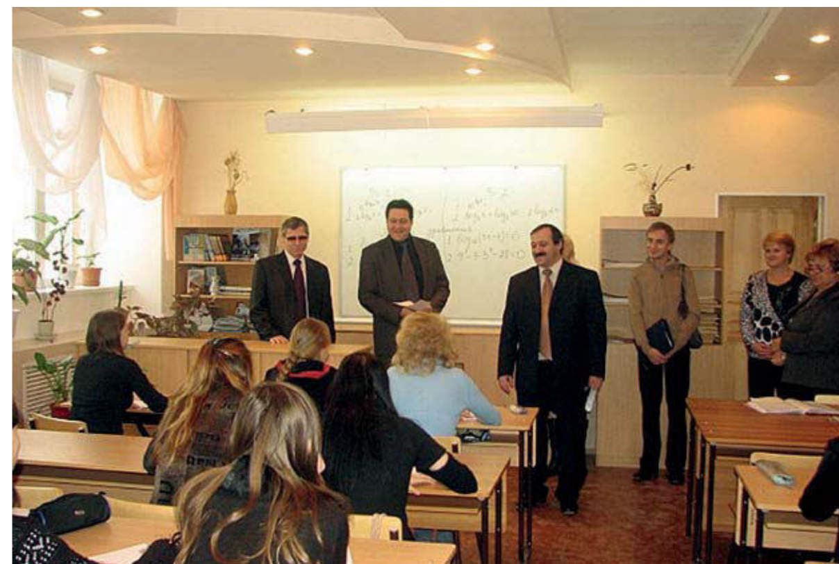
Мониторинговый визит Министерства просвещения Российской Федерации по реализации Национального проекта образования. 13.11.2007 г.