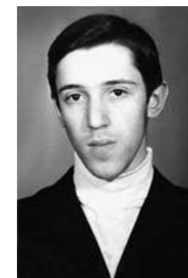
Январь 1970 года