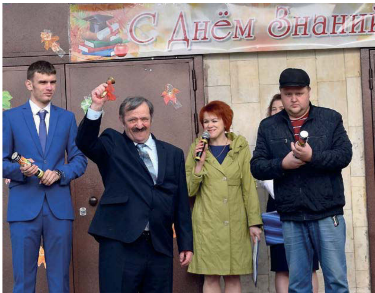
День знаний. 01.09.2018 г.