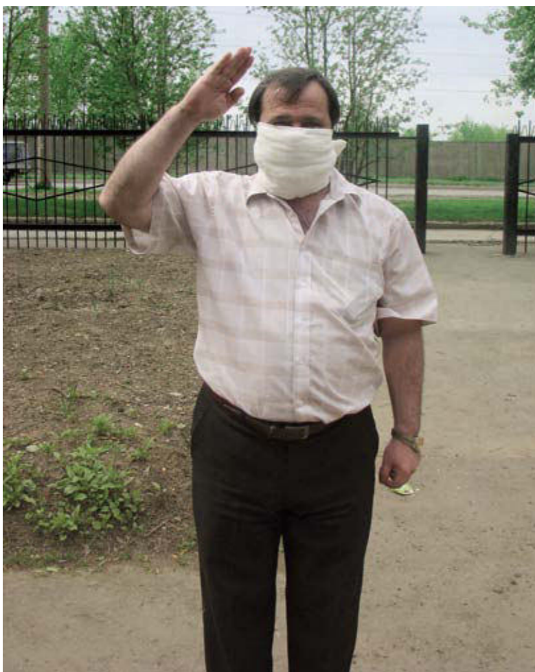
24.05.2007 г. Нижний Тагил. Проведение учебной тренировки по эвакуации в случае ЧС в техникуме. 24.05.2007 г.