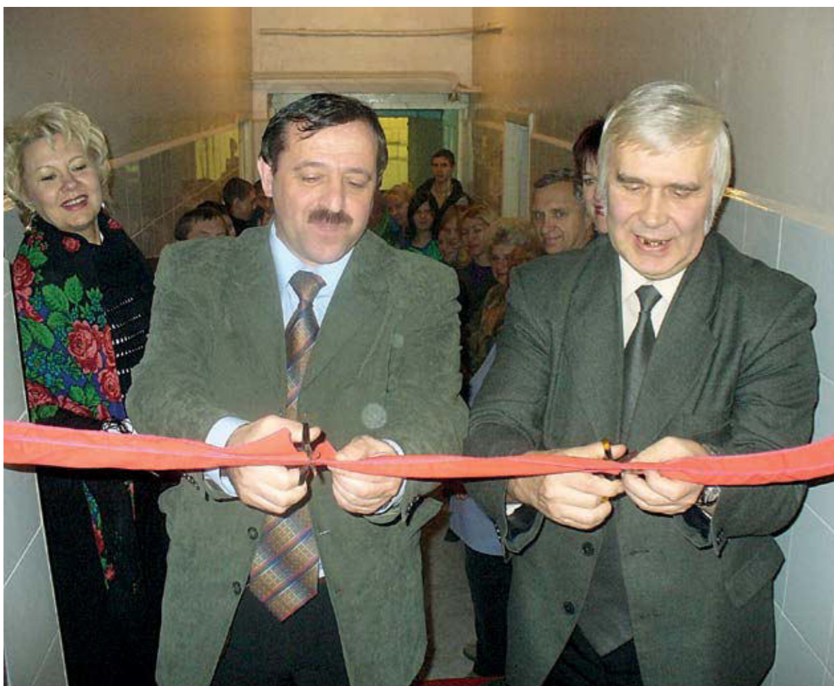
Открытие спортивного зала техникума после ремонта. 27.11.2005 г.