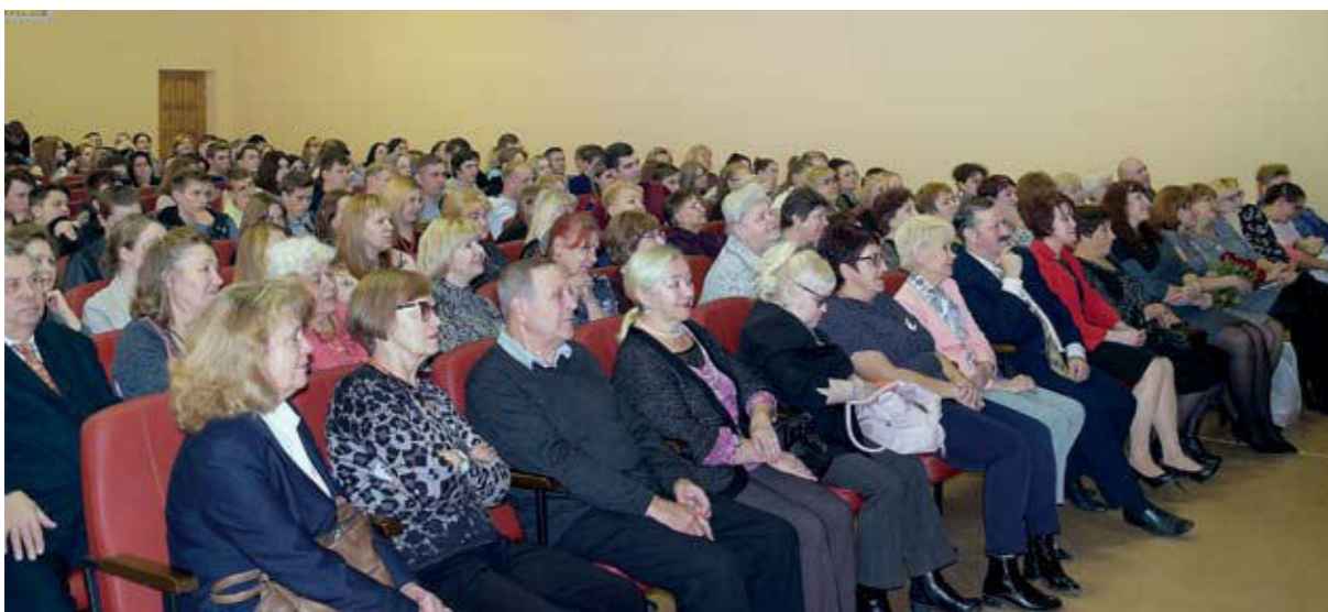
Юбилейный вечер. 2019 г.

На праздничное мероприятие были приглашены сотрудники и студенты НТТМПС, ветераны образовательных учреждений, которые присоединились к техникуму в 2010 году - «Профессионального училища № 14» и «Нижнетагильского профессионального машиностроительного училища».