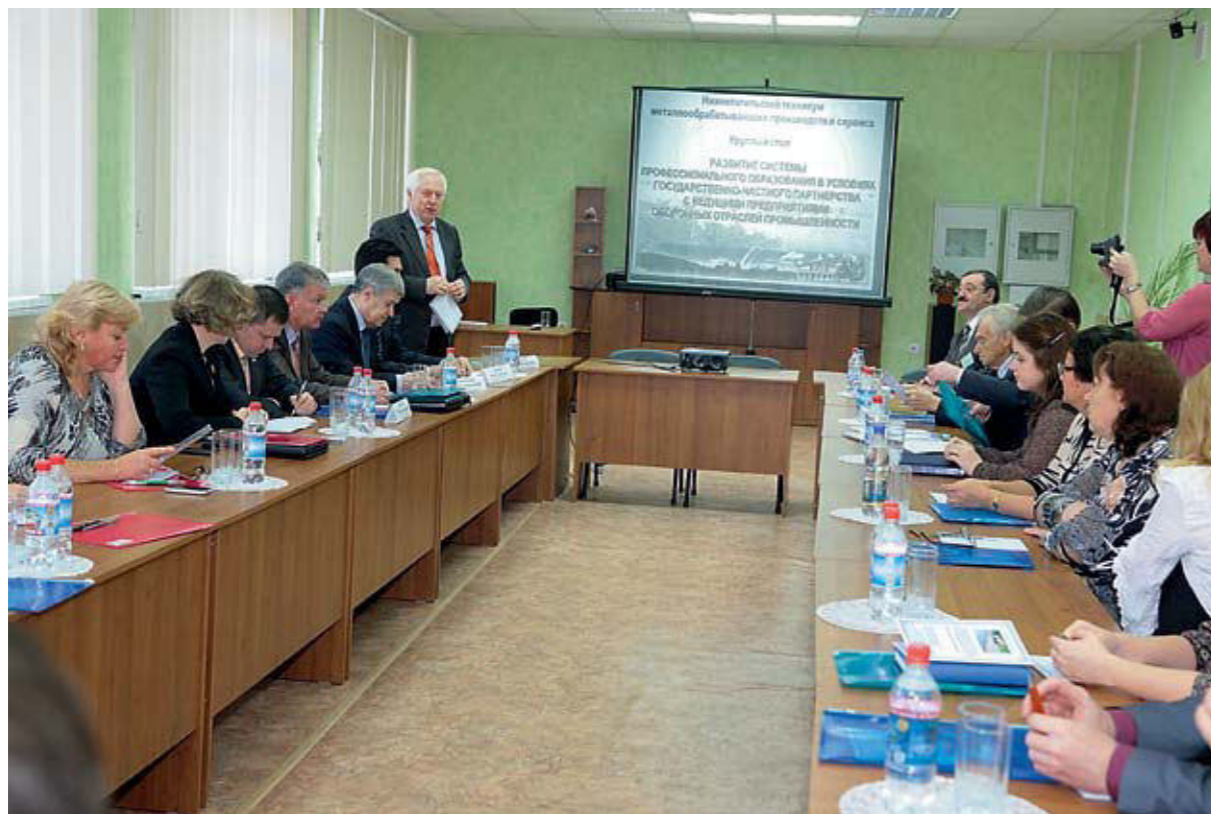
Участники круглого стола. 2012 г.

12 октября 2012 года на базе Нижнетагильского техникума металлообрабатывающих производств и сервиса состоялась встреча представителей Министерства общего и профессионального образования Свердловской области, Союза предприятий оборонных отраслей промышленности, образовательных учреждений Свердловской области. Участники встречи обсуждали проблемы развития системы профессионального образования на этапе внедрения стандартов нового поколения и дальнейшее развитие государственно-частного партнерства с ведущими предприятиями оборонных отраслей промышленности.