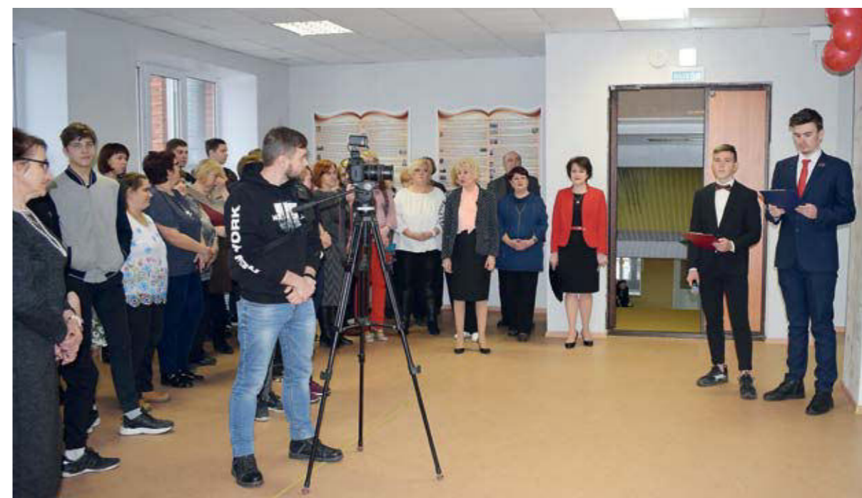
Открытие музея истории НТТМПС. 2019 г.

Музей истории стал местом, где соединились неразрывной нитью люди разных поколений, внесшие значительный вклад в развитие профессионального образования Свердловской области.