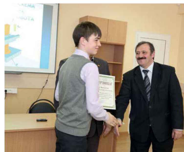
Вручение сертификатов школьникам 51 лица после прохождения курса предпрофильной подготовки по программе «Основы управления автоматизированными и роботизированными комплексами». 07.05.2014 г.