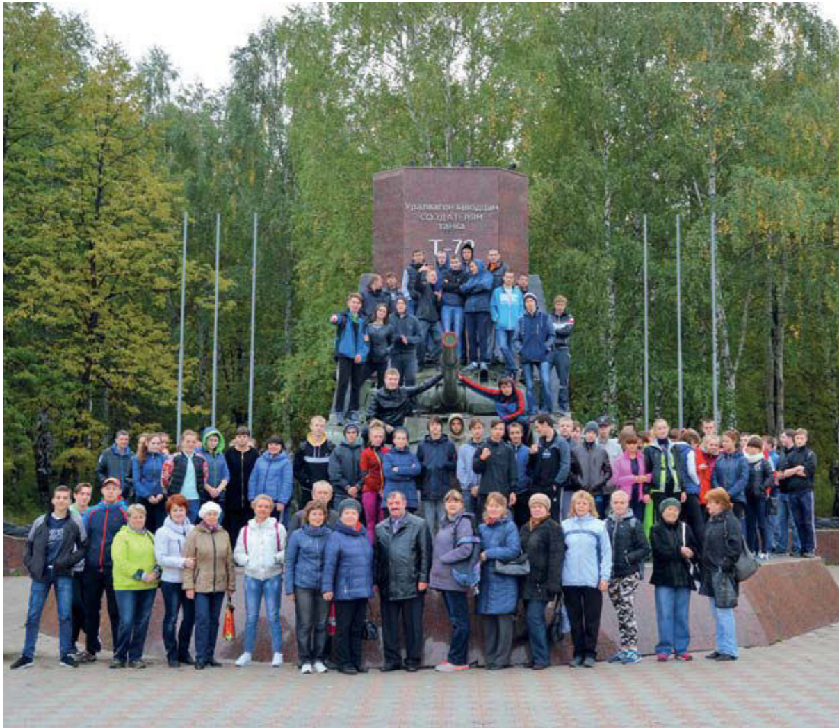
День здоровья для студентов на лыжной базе АО «НПК «Уралвагонзавод». 20.09.2016 г.