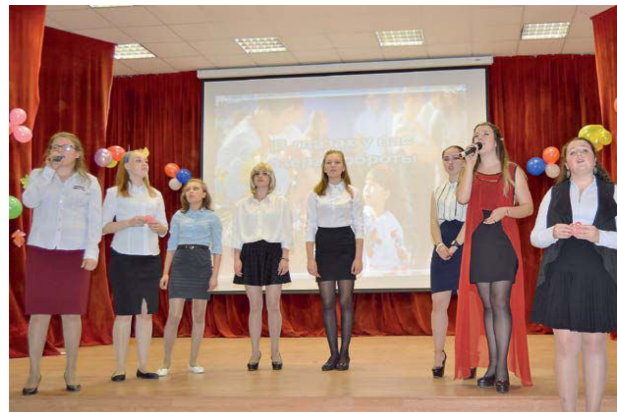
Поздравление педагогов с профессиональным праздником «День учителя» от директора и студентов НТТМПС. 05.10.2017 г.